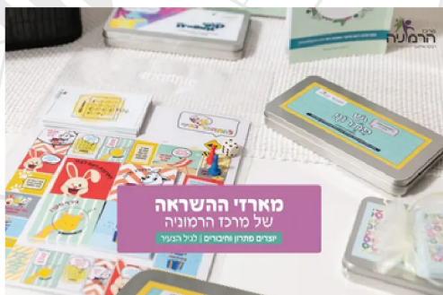
מארזי השראה של מרכז הרמוניה יוצרים פתרון וחברים | ליל הילדים

במהלך יום-יום של הילדים הם נפגשים בסיטואציות חברתיות חלקן נעימות וחלקן פחות, המארז מאפשר להורים לדון עם הילדים בפתרונות מתאימים שכדאי לבחור.