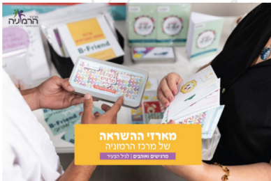
מארזי השראה של מרכז הרמוניה מרגישים ואוהבים | לגיל הצעיר