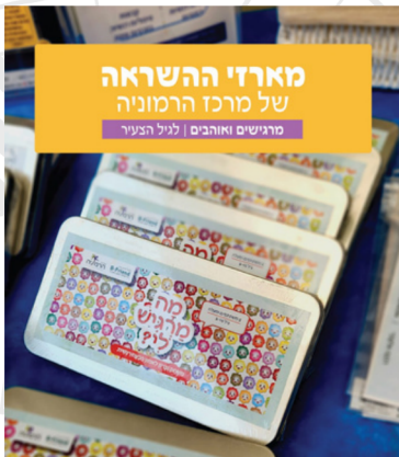
מארזי השראה של מרכז הרמוניה מרגישים ואוהבים | לגיל הצעיר

להיות מודע רגשית זו מיומנות נרכשת ויש לך אפשרות לאמן את הילד כבר מעכשיו.